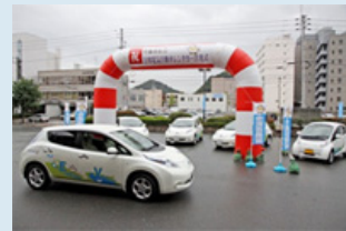
EVレンタカー出発式

平日は各市が公用車として使用している電気自動車を、土日・休日に市民や観光客に貸し出す事業を行政と協働で行い、環境に優しい自動車の有効活用や普及・啓発に努めています。